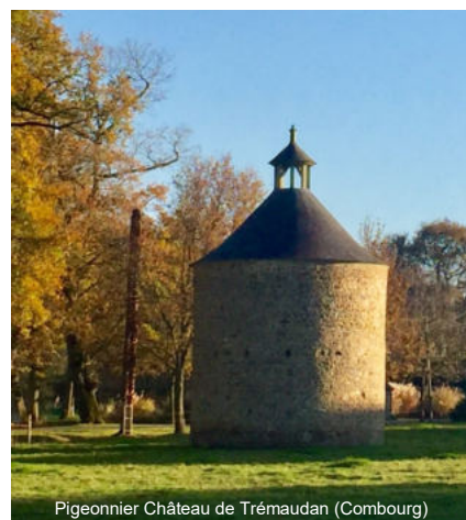
Pigeonnier Château de Trémaudan (Combourg)