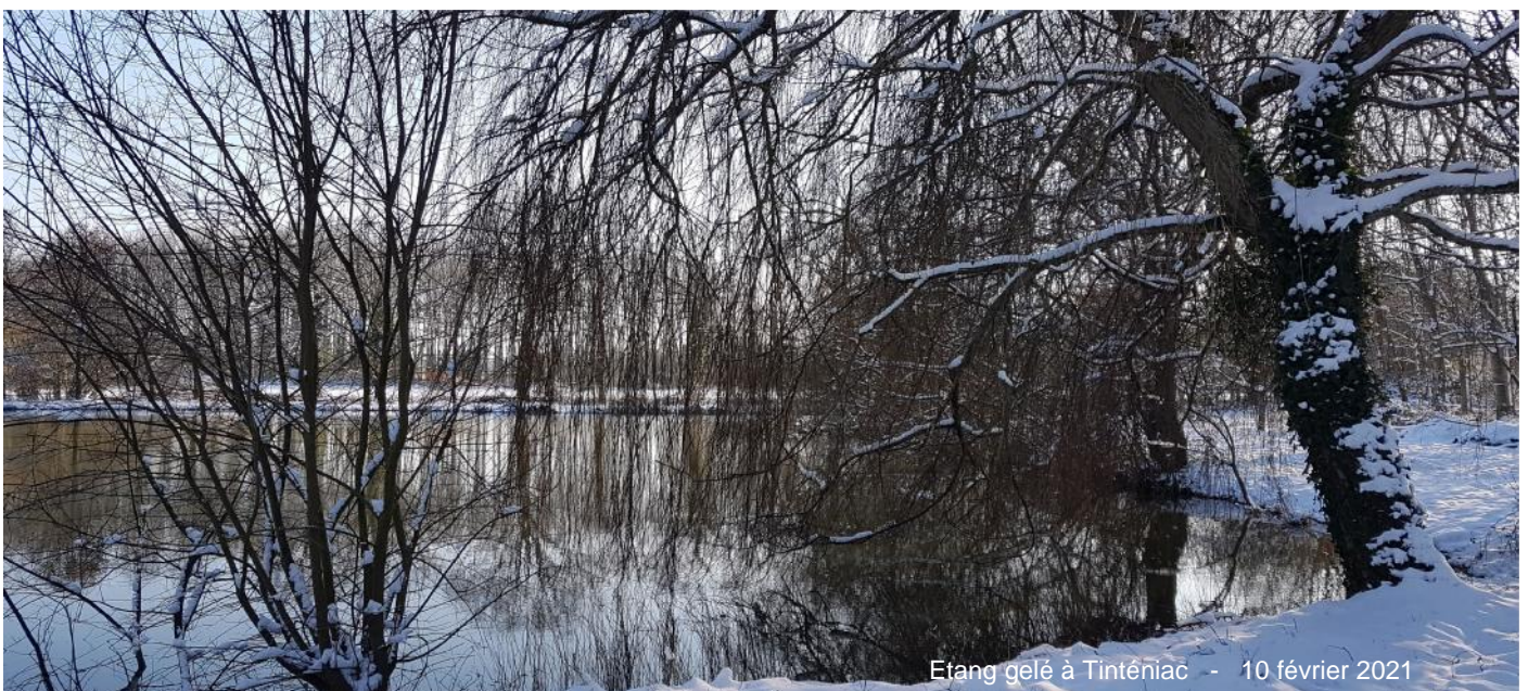
Étang gelé à Tinténiac - 10 février 2021

C'est une organisation différente qui s'impose à nous et c'est pourquoi nous vous proposons, pour le moment, une activité par semaine au lieu de deux. Adressez-nous vos idées, vos réactions, vos suggestions, vos demandes d'aide pour vous connecter. Merci aussi pour vos messages enthousiastes et chaleureux qui nous encouragent à nous maintenir sur le pont contre virus et morosité ! Le CA