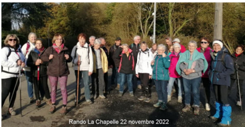
Rando La Chapelle 22 novembre 2022