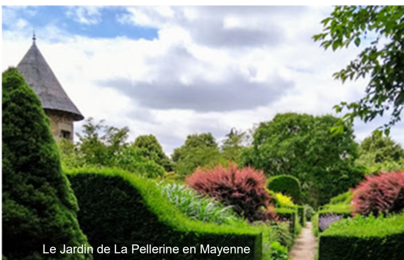
Le Jardin de La Pellerine en Mayenne

Autre occasion de se rencontrer à ne pas rater : la sortie annuelle du 23 mai en car . Le matin visite du musée de Robert Tatin à Cossé le Vivien, pique-nique et l'après-midi balade parmi les roses et les frondaisons du beau jardin de La Pellerine près de Laval. Nous disposons de 62 places . Alors n'hésitez pas à partager cette journée de mai avec nous. Le CA