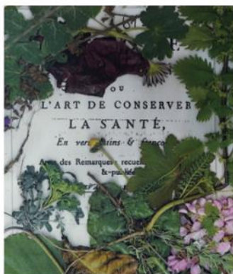
6 & 7 mai ondine cloez l'art de conserver la santé

L'âge de nos pères est un spectacle sur le groupe, familial ou social, qu'on choisit ou qu'on subit, et la façon dont il nous traverse, nous porte et nous bouscule. Entre le Joli collectif et lacavale, il y a cette même recherche : comment le réel peut s'inviter sur scène et s'y déployer avec les outils du spectacle vivant ?