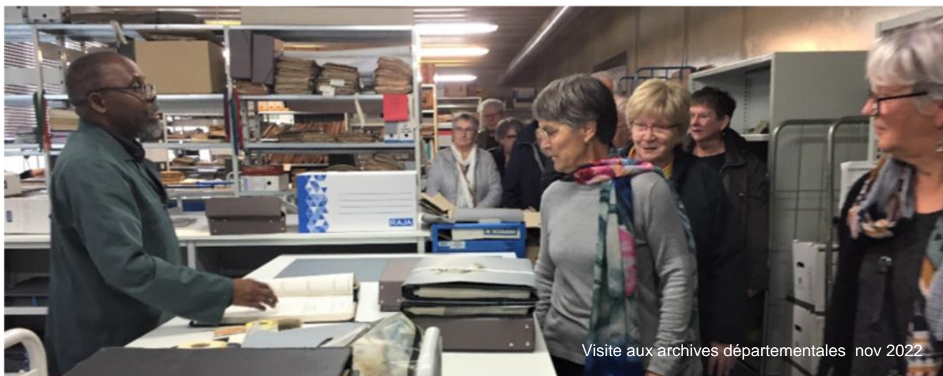
Visite aux archives départementales nov 2022

Mais avant, pendant les vacances de Noël nous vous donnons rendez-vous au cinéma de Combourg pour voir « le Petit Nicolas » film sorti en 2022 et salué par la critique. Venez avec vos enfants, vos ados, vos petits-enfants à partir de 6 ans. (cf rubrique partage). Pour cette occasion exceptionnelle ils sont tous invités à l'UTL !