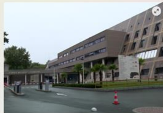
La clinique de La Sagesse à Rennes est victime depuis le jeudi 3 octobre d'une cyberattaque.