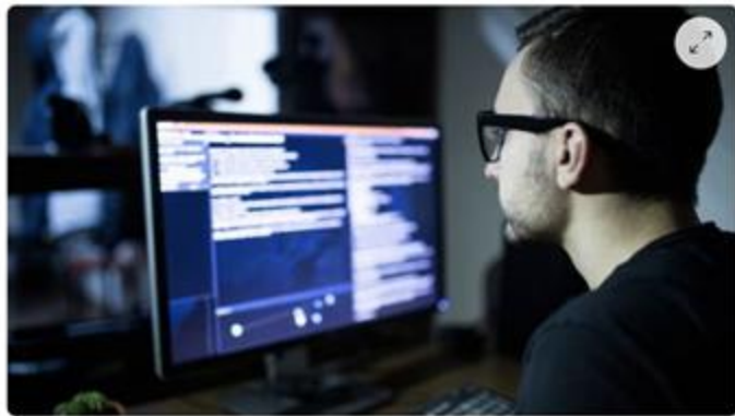
Le groupe Eureden en Bretagne est victime d'une cyberattaque en ce mois de mars 2022.

Eureden fait l'objet, depuis jeudi 17 mars 2022, d'une cyberattaque. Le groupe a « immédiatement pris des mesures pour circonscrire cette attaque » et a informé les autorités compétentes. Ce type d'attaques malveillantes se multiplie à l'encontre des grandes entreprises. Et a d'ailleurs provoqué la création, à Rennes, d'une agence nationale de cybersécurité, l'Anssi.