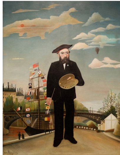
Le douanier Rousseau, Moi-même , portrait paysage, huile sur toile, 146 x 113 cm, 1890, Prague, Galerie Nationale.

Art brut, art naïf, arte povera, art des fous... Autant de termes accolés à des productions artistiques bien différentes évoluant dans des conditions hétérogènes. Loin des grandes écoles, l'art peut aussi vous surprendre au détour d'une rencontre avec l'inconnu. En complément de cette dernière séance, une visite au musée Robert Tatin, en Mayenne, est envisagée, à vos agendas !