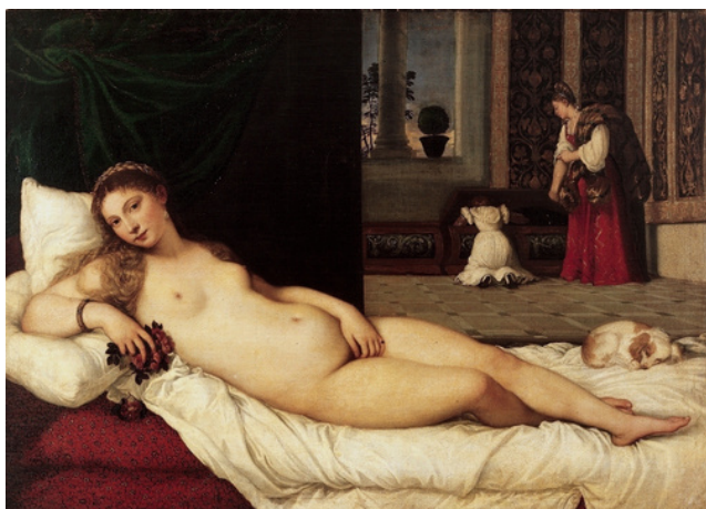
Le Titien, Vénus d'Urbino , v. 1538, huile sur toile, 119 x 165 cm, Florence, Galerie des Offices.

Une séance librement inspirée du célèbre ouvrage de cet historien de l'art français décédé en 2003 - et de sa série radiophonique sur France Culture. Des exemples de lectures d'œuvres riches en enseignement, à découvrir ou redécouvrir sans modération.