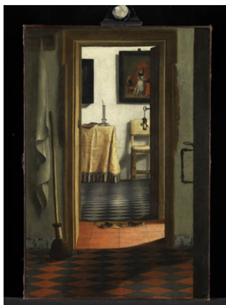
Samuel Von Hoogstraten, Les pantoufles , v. 1654-1662, huile sur toile, 130x70 cm, Paris, musée du Louvre.

De Brueghel l'ancien aux frères Le Nain, de nombreux peintres se sont inspirés de la vie quotidienne pour créer de grandes œuvres. Loin des antiques récits mythologiques ou des plus importants faits historiques, la scène de genre se taille une place de choix dans l'histoire de la peinture.