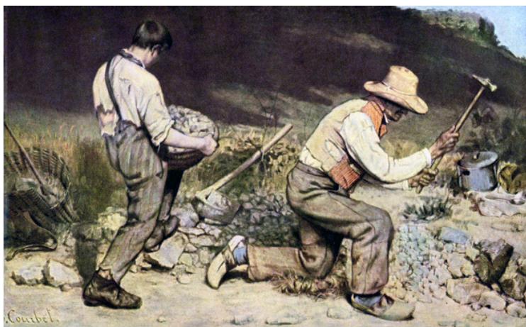
Courbet, Les casseurs de pierre , 1849. Détruit en 1945.

Au milieu du XIXe siècle, un jeune peintre franc-comtois agite le monde des Salons parisiens. Il s'agit de Courbet, dont le langage pictural et la vision politique révolutionnaires vont faire trembler les cénacles de la grande peinture. Son succès et sa célébrité seront à la mesure des charges dont il sera plus tard reconnu coupable. Avec lui, le Réalisme n'est pas un vain mot.